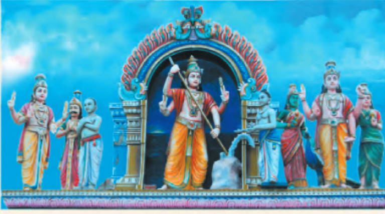
கூரணை வதைத்த வேலின் உக்கிரத்தைத் தணிக்க, கடற்கடரையில் வேலினைப் பாய்ச்சி நாழிக்கின்ற தீர்த்தம் உருவாக்கிய காட்சி