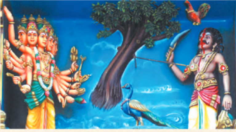
கூரணை இரு சுவாக்கி மயில் வாகனமாக, சேவல் கொடியாக ஆட்கொள்ளும் காட்சி